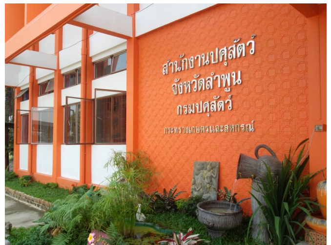
จัดให้มีสวนหย่อมในสำนักงาน