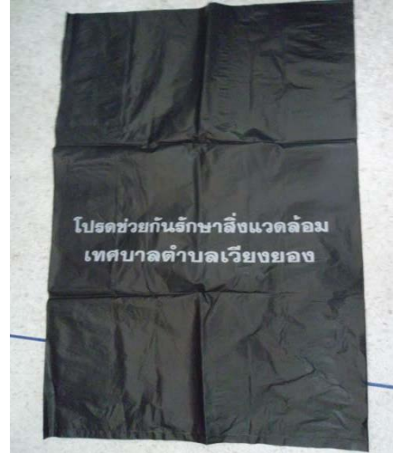
จัดซื้อถุงขยะของเทศบาล