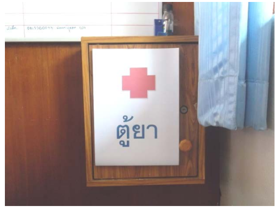
จัดให้มีตู้ยาสามัญประจำบ้าน