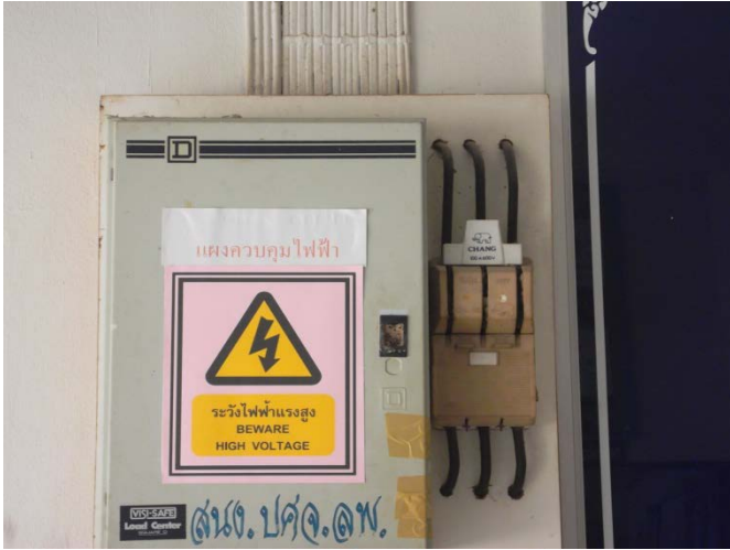
จัดทำป้ายเตือนอันตรายแผงควบคุมไฟฟ้า