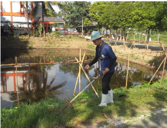
กิจกรรม Big Cleaning Day เดือนละ 2 ครั้ง เป็นประจำ ทุกเดือน