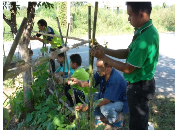
ปลูกผักสวนครัวรั้วกินได้