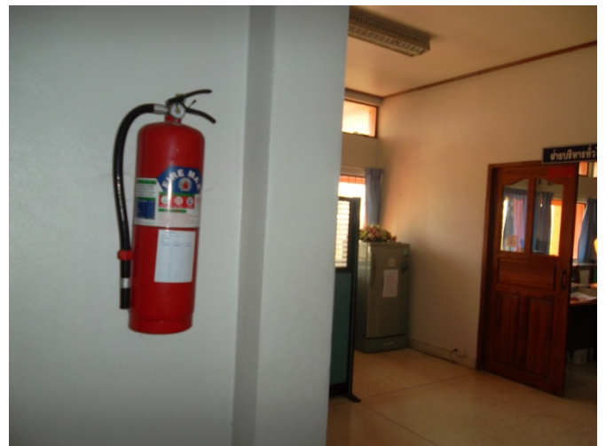
จัดสถานที่เก็บถังดับเพลิง และตรวจสอบสภาพ