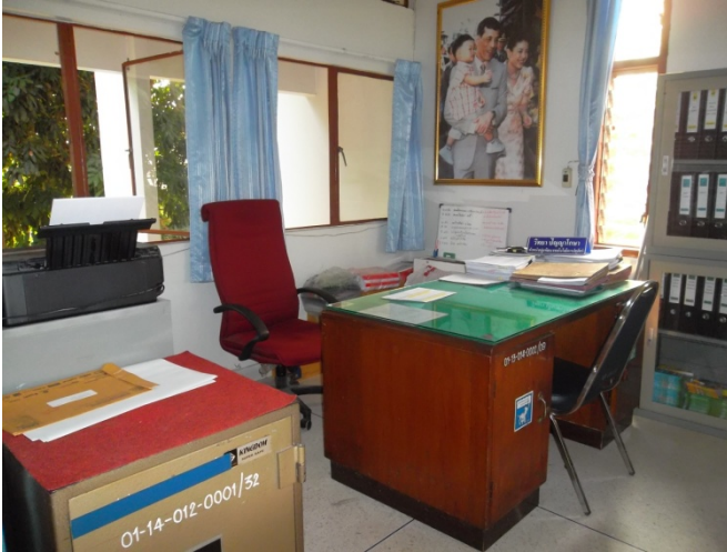
จัดมุมโต๊ะทำงาน