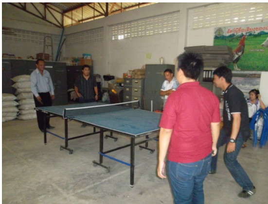
จัดให้มีสถานที่ออกกำลังกาย ทุกเย็น