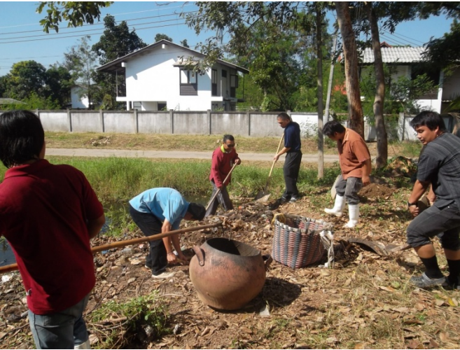
กิจกรรม 5 ส