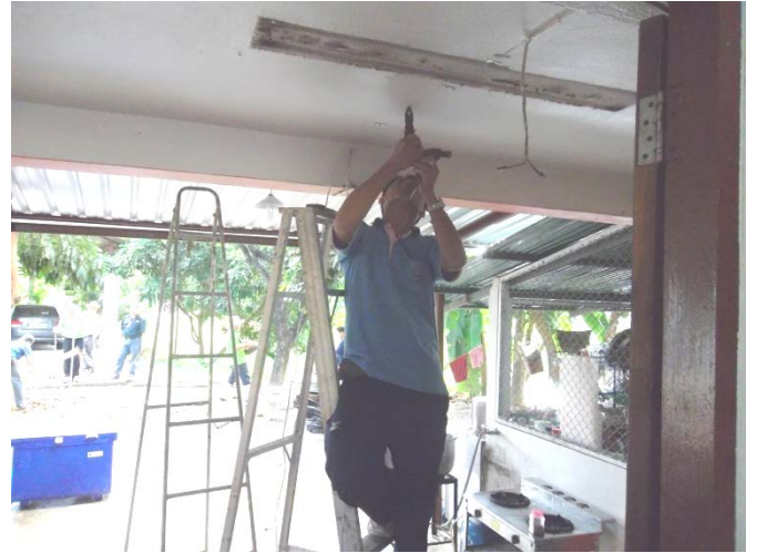
ตรวจสอบและซ่อมแซมอุปกรณ์ไฟฟ้า ทุก 3 เดือน