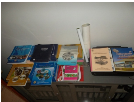
มุมความรู้