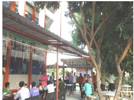
จัดกิจกรรมปีใหม่