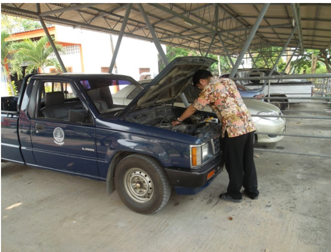
ตรวจสอบและทำความสะอาดเป็นประจำทุกสัปดาห์