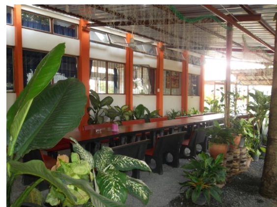
มุมพักผ่อน