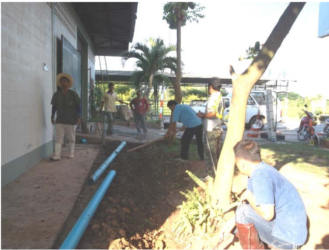
จัดทำท่อระบายน้ำทิ้งใหม่