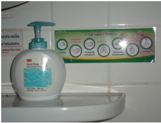
ติดป้ายประชาสัมพันธ์วิธีการล้างมือ 7 ขั้นตอน