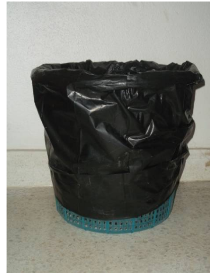
จัดสถานที่ทิ้งขยะ