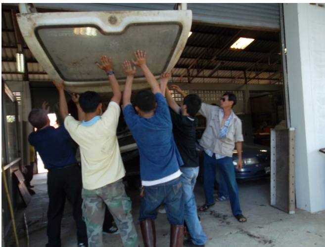
กิจกรรม Big Cleaning Day เดือนละ 2 ครั้ง เป็นประจำ ทุกเดือน