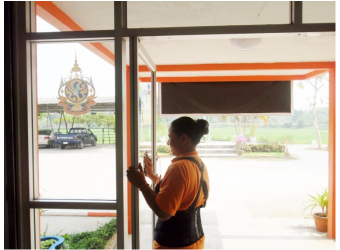
ทำความสะอาดประจำวัน